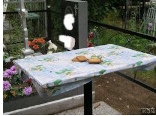
Karjalaisessa ortodoksisessa perinteessä viedään edelleenkin haudoille ruokaa. Kuva Uudeltakirkolta kesällä 2008

Myyttien sisällön tuntemusta tarvittiin, kun haluttiin järjestää erilaisia rituaaleja . Jokaisessa yhteisössä oli tietäjä-samaani, jolla oli yhteisön kunnioitus ja ehdoton auktoriteettiasema. Hän oli rituaalien erikoisasiantuntija ja niiden suorittaja. Näitä kaavamaisia toimintoja voitiin järjestää esim. jumalien tai henkien lepyttämiseksi, kiitokseksi hyvästä saaliista (uhrirituaaleja) tai kun perheeseen syntyi lapsi, nuoren siirtyminen lapsuudesta aikuisuuteen (initiaatio), mies ja nainen alkoivat elää pariskuntana tai kun joku kuoli. Viimeisiä kutsutaan siirtymäriiteiksi .