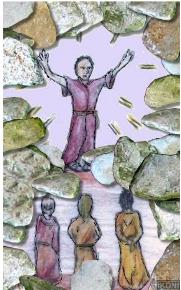
Suullisen perimätiedon "jakelu"

Varhaiskantaisiksi uskonnoiksi kutsutaan uskontoja, joilla ei ole omaa pyhää kirjaa. Nämä uskonnot ovat syntyneet jo ennen kirjoitustaidon keksimistä ja ovat säilyttäneet useinkin maantieteellisesti syrjäisen asemansa vuoksi yhteytensä teknisesti korkeampiin kulttuureihin kaukaisena. Nykyään eläviä tunnetuimpia alkuperäiskansoja ovat Australian aboriginalit, Pohjois-Amerikan navajointiaanit, Siperian alkuperäiskansat ja Afrikan bushmannit, Kanadan inuitit ja Uuden -Seelannin maorit. Muinaissuomalaisten uskonto oli myös varhaiskantainen uskonto. Varhaiskantaiset uskonnot eivät ole kaikki samanlaisia, vaan niiden uskomusperinne ja tavat voivat olla hyvinkin erilaisia. Kuitenkin niillä on paljon yhteisiä piirteitä: